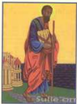
Sulle orme di Paolo a Roma

In data da concordare è offerta la possibilità di un pellegrinaggio a Roma sulle tombe degli apostoli Pietro e Paolo in occasione dell’Anno Santo Paolino. Se sei interessato martedì 28 ottobre ci incontriamo per vedere di organizzarci insieme e preparare l’evento